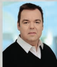
L. Simon László országgyűlési képviselő a Velencei-tó és Térsege, Váli-völgy, Vértés Térsegi Fejlesztési Tanács elnöke

Mint a Velencei-tó partján élő, a környék szépségeit és lehetőségeit használó és élvező országgyűlési képviselő örömmel számolok be arról, hogy a tó körüli kerékpárutak fejlesztése idén nagy léptékben folytatódhat. Két sikeres pályázatnak és az Orbán-kormány támogatásának köszönhetően a déli parton, Dinnyés és Velence között több, mint 12 kilométernyi kerékpárutat építhetünk (ebből 9 km-nél többet új nyomvonalon), miközben a hozzá kapcsolódó szolgáltatások is fejlődnek. Ugyancsak ebben az évben elkezdődhet annak az összesen 32,6 kilométernyi, 9 szakasznak a tervezése, amelyek a keleti és az északi parton, Velencétől Dinnyésig teremtik majd meg a biztonságos bringázás lehetőségét. Ezek a fejlesztések újabb lökést adnak a Velencei-tó turizmusának. Így a jövőben nemcsak nyáron és nem csupán a fürödni vágyókat vonzhatja a tó, hanem az év bármely szakában, az aktív kikapcsolódásra vágyókat is. Nyeregbe! Ha már jártak nálunk, jöjjenek újra, hogy lássák a változást. Ha még nem kerekeshettek a tó körül, tapasztalják meg mind azt a szépséget és vendégszeretetet, amit a Velencei-tó és a környékén élők kínálnak.